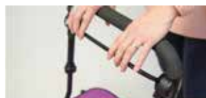
Freno manual instantáneo