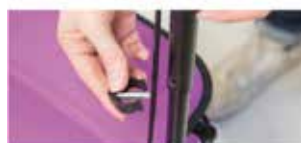
Manillar regulable en altura