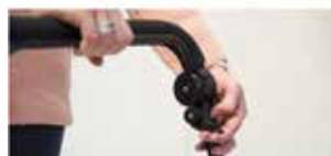
Palanca de bloqueo de frenado